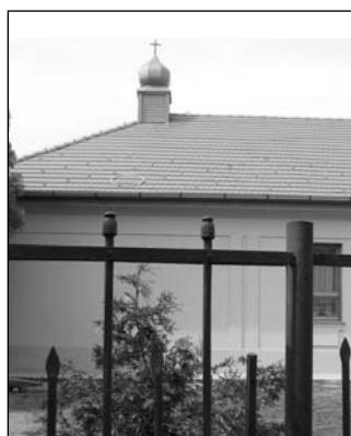
Ennyi maradt a dicsőséges múltból