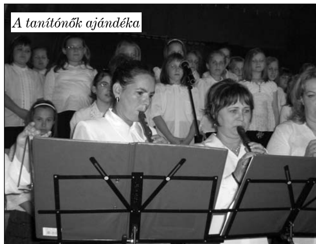
A tanítónők ajándéka