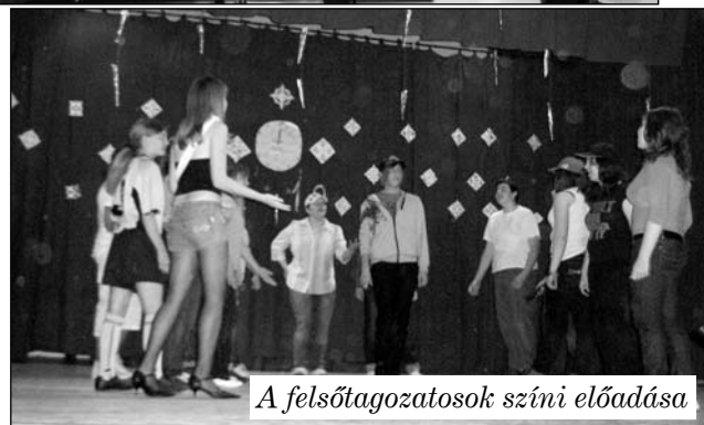
A felsőtagozatosok színi előadása