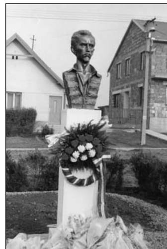
Eredeti helyén álló Petőfi-szobor