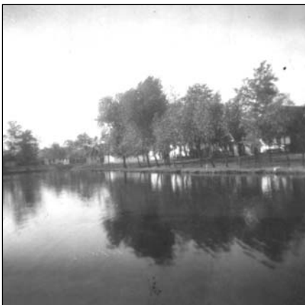
A kartali tó 1939-ben

Elfogult, bár így, cirka 50 év messzeségéből már igazán tarthatna távolságot az ember, de van, hogy nem megy. Tanú. Hallja az esti béka-koncerteket, tudja még a kivágott hét-nyárfákat... Tanúsítja, hogy ez vagy az volt, de csak úgy, ahogy ő látta, ahogy őt érintette. Az emlékezet csal, szépít, kiegészít, formál... él és éltet.