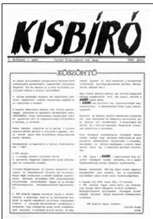
Az első Kisbíró – 1990. június

– A Kisbíró körülbelül 1994 közepe táján lett az önkormányzat lapja. Valószínű, hogy ekkor már a polgármesteri hivatal részéről is jött a felkérés, de az is elképzelhető, hogy ezzel egy időben a művelődési ház részéről is kiment ez a kérelem. Tény az, hogy az utolsó években rendkívül színvonalatlan volt az újság. És ezt nemcsak mi, a képviselők láttuk így, hanem a lakosság részéről is sokan. Mi sem bizonyítja ezt jobban, mint-hogy 2003–2004 környékén megjelent egy új, ingyenes kiadvány a Zöld Kisbíró , aminek óriási sikere volt pusztán azért, mert visszatért oda, hogy első-sorban magánemberek érdekes cikkeit jelentesse meg.