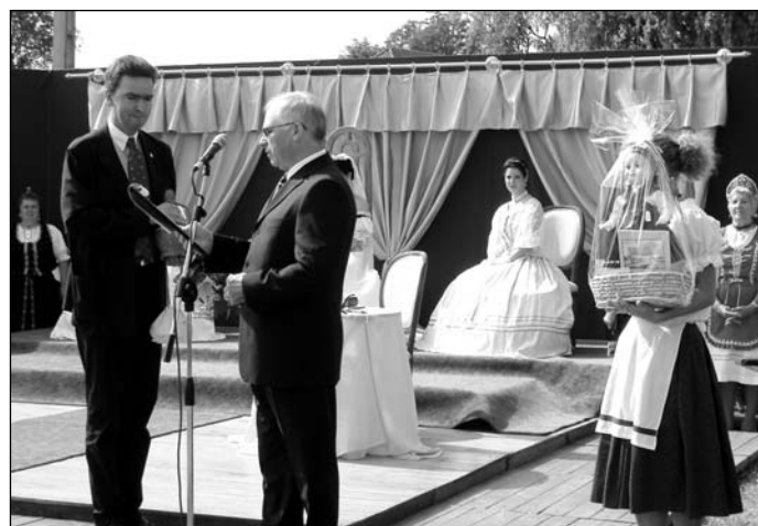
Habsburg György eredeti magyar pálinkát is kapott ajándékba...

Miután a rögtönzött trónuson a keces királynő elfoglalta helyét, elkezdődött a megemlékező ünnepség. Köszöntőt mondott Tóth Ilkó Mihály , Kartal polgármestere és Szabó Ádám , Kerekharaszt polgármestere, valamint a díszvendég, Habsburg György is.