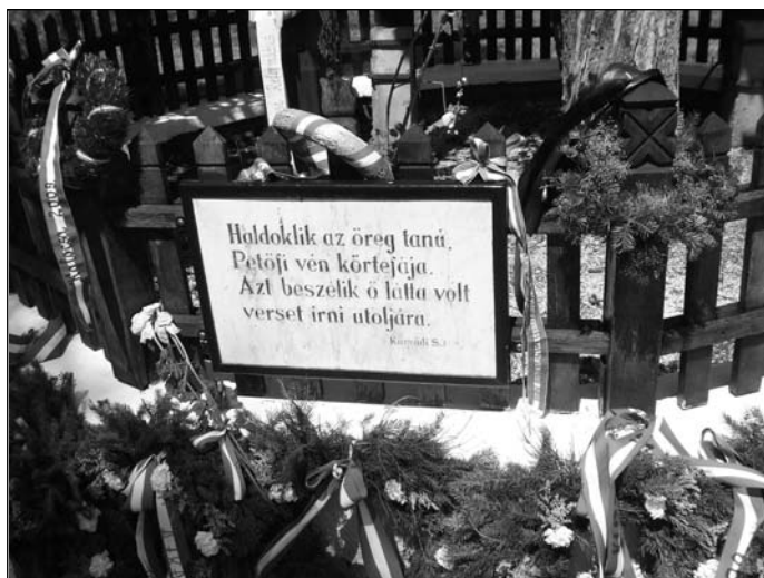
Emléktábla Székelykeresztúron Petőfi körtefájánál

Kartalnak testvértelepülési kapcsolata egyelőre még nincs. A közeli településeknek egy vagy több testvértelepülési kapcsolata is van, Aszódnak kettő Erdélyben és egy Németországban. ■