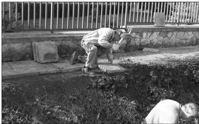
A Lapos kocsma mögötti járdát szintén rendbe hozták

A felső tagozatos iskolánál az úton közlekedtek a gyerekek. A hosszú kerítés mellett kiszínterezték és kiszélesítették a járdát. Kitakarították az árkot.