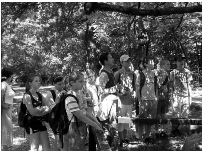
Kirándul a tábor

Az első napot ismerkedéssel, a könyvtári tudnivalók megbeszélésével indítottuk, majd délután megkezdtük az ismerkedést Böszörményi Gyula életével és műveivel. Ez a foglalatosság az egész hetünket végigkísérte, és hogy ne legyenek „egyhangúak” napjaink rendeztünk egy könnyű akadályversenyt, moziban jártunk, torpedóztunk, vetélkedtünk, diafilmeket vetítettünk, felolvastunk, és barangoltunk az interneten.