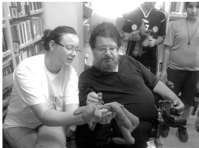
Az író a felesége társaságában