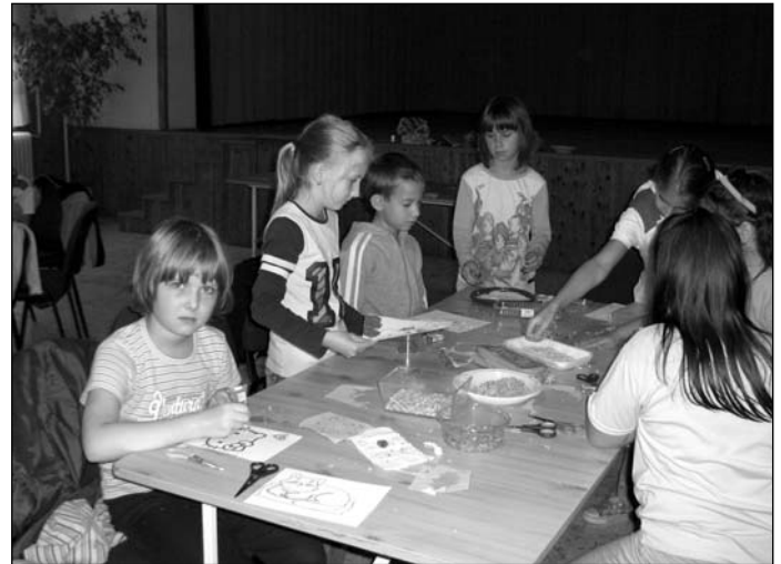
Munka közben a gyerekek