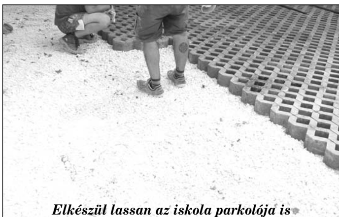
Elkészül lassan az iskola parkolója is