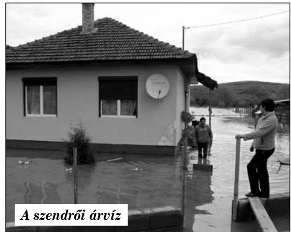
A szendrői árvíz