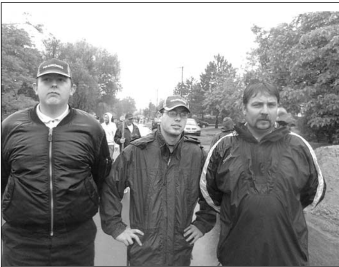
Polgárőrök a szakadó esőben