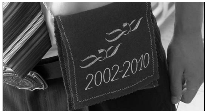
Közel 70 nyolcadikos ballagott el az idén a felső tagozatból